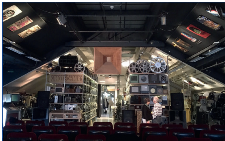
Die Kinemathek voller Raritäten.

Das Lichtspiel, die Kinemathek in Bern befindet im Dachstock eines alten Industriegebäudes und befasst sich mit der Sammlung von Filmrollen (inzwischen mehr als 25'000) und Geräten rund um das private, professionelle und kommerzielle Filmen. Die Kinemathek sammelt nicht aktiv, ein grosser Teil der Filme stammt aus Nachlässen oder Schenkungen. Sie sichtet, katalogisiert, restauriert, konserviert und führt regelmässig öffentliche Anlässe durch, die oft mit Trouvaillen aus dem Archiv zu tun haben. Jeden Sonntagabend bietet sie eine öffentliche Aufführung aus ihren Beständen an, meist anhand eines über längere Zeit laufenden Themas. Getragen wird sie von einem Verein; sie ist auch eine Dienstleisterin. Die Kinemathek steht auch